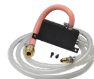
Eiettore ad aria compressa

Tutte le informazioni possono essere soggette a modifiche senza alcun preavviso. 1807