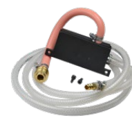
Perslucht ontluchting hulpstuk