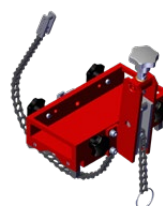
DMP 251 Pijpbevestiging hulpstuk