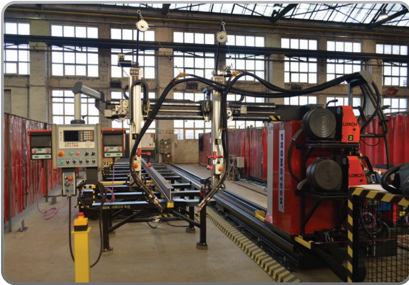
■ GWS tipo WA 1000 Equipaggiato con LORCH S8