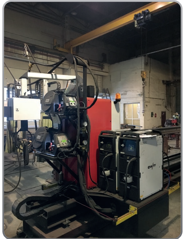
■ GWS tipo WA 1000 Equipaggiato con EWM Phoenix