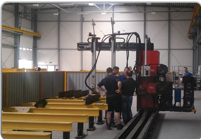
■ GWS tipo WA 1000 Equipaggiato con LINCOLN ELECTRIC PW500S