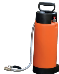
Druckkühlmittel 5l Flascheneinheit PJM-0676-10-00-00-0