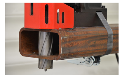
Startpunt van het boren tot 50 mm onder het niveau van een boorbasis