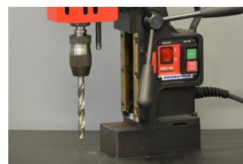
Adapter MT2 x 1/2" 20 UNF, snelwissel boorhouder 1/2" 20 UNF Spiraalboor tot \Phi 16.0 mm (DIN 338)