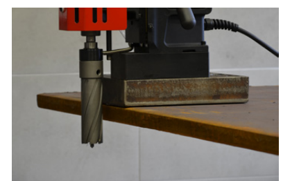
Startpunt van het boren tot 50 mm onder het niveau van een boorbasis met 100 mm lange frees