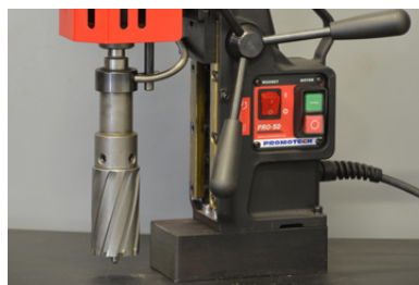
TCT kernboren tot 50 mm met as AMT2-C19/2-3 D.O.C. tot 75 mm