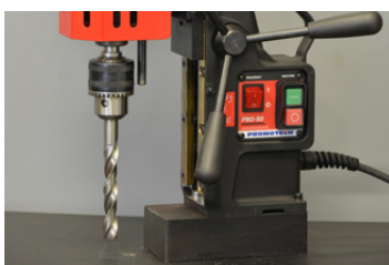
Adapter MT2 x 1/2" 20 UNF, Boorhouder 1/2" 20 UNF Spiraalboor tot \Phi 16.0 mm (DIN 338)