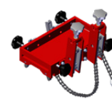
Buisbevestiging hulpstuk DMP 501