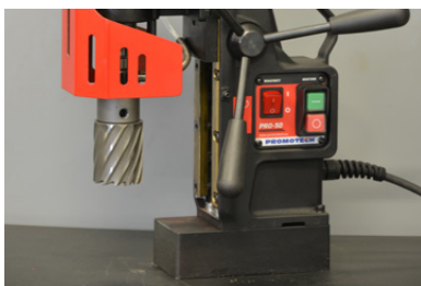
HSS-kernboren tot \Phi 45 mm