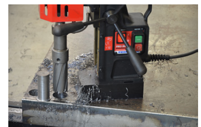
Kernboor max 55 mm Max frees diepte 75 mm