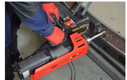
Boren uit positie