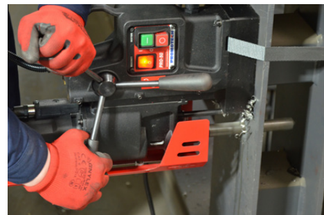
Spiraalboor capaciteit tot 23 mm