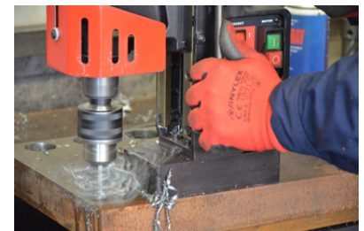
Spiraalboor capaciteit tot 16 mm met cilindrische schacht spiraalboor in gebruik Spiraalboor capaciteit tot 23 mm met MT2 schacht spiraalboor in gebruik