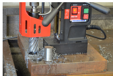
Kernboor max 50 mm Max frees diepte 75 mm (optie)