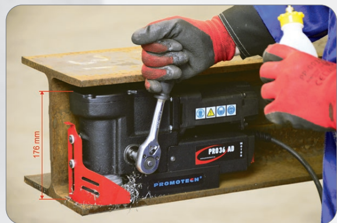
PRO-36 AD entra en los lugares más estrechos